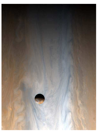
(Io devant Jupiter, photographiée par la sonde Galileo)

Callisto, le second en taille, possède une couche de glace de 2000 km qui recouvre de cratères. Le troisième en taille, Io, est « à zizz » à cause de sa surface couverte de cratères volcaniques qui s'écoulent à des centaines de kilomètres de hauteur.