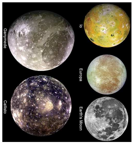
(comparaison avec notre lune)

Ganymède, le plus gros, a une épaisse couche de glace qui recouvre sans doute une couche d'eau qui descend jusqu'à son noyau rocheux.